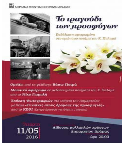
Εικόνα 13: Υλικό δημοσιότητας – αφίσα που εξέδωσε ο διοργανωτής Σύλλογος για τις ανάγκες της εκδήλωσης στη Δράμα