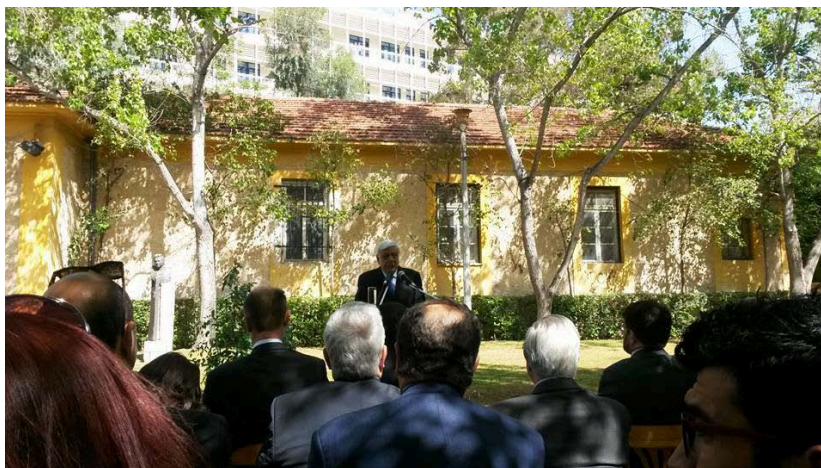
Εικόνα 4. Φωτογραφικό στιγμιότυπο από την επίσημη εκδήλωση έναρξης της λειτουργίας του Ε.Σ.Ρ.Μ.