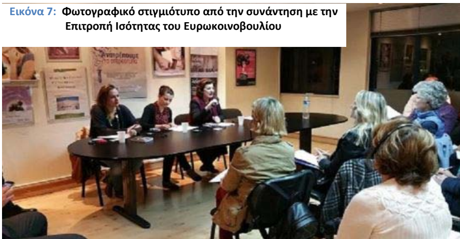
Εικόνα 7: Φωτογραφικό στιγμιότυπο από την συνάντηση με την Επιτροπή Ισότητας του Ευρωκοινοβουλίου