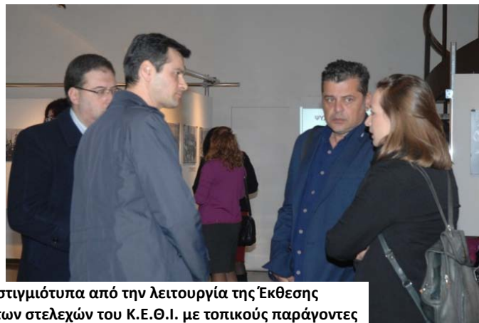
Σύμπλεγμα Εικόνων 8: φωτογραφικά στιγμιότυπα από την λειτουργία της Έκθεσης φωτογραφίας στην Χίο και τις συναντήσεις των στελεχών του Κ.Ε.Θ.Ι. με τοπικούς παράγοντες