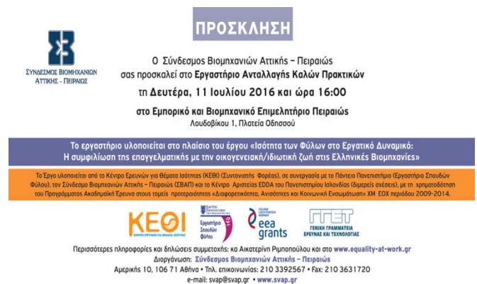
Σύμπλεγμα Εικόνων 1: Στιγμιότυπο από τις συναντήσεις των στελεχών του Κ.Ε.Θ.Ι. στην Ισλανδία και η Πρόσκληση για το Εργαστήριο Ανταλλαγής Καλών Πρακτικών στον Πειραιά