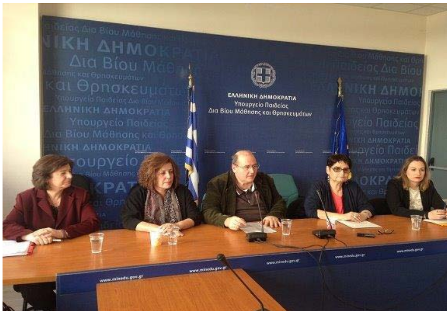
Εικόνα 5: Φωτογραφικό στιγμιότυπο από την κοινή συνέντευξη Τύπου