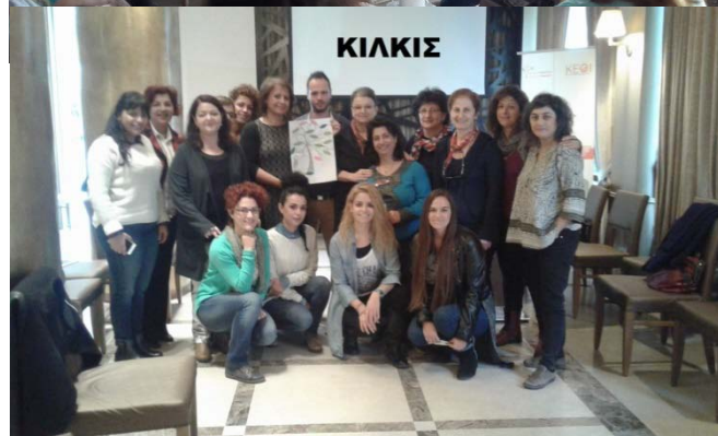
Σύμπλεγμα Εικόνων 3: Ενδεικτικές φωτογραφίες από τα κατά τόπους Σεμινάρια