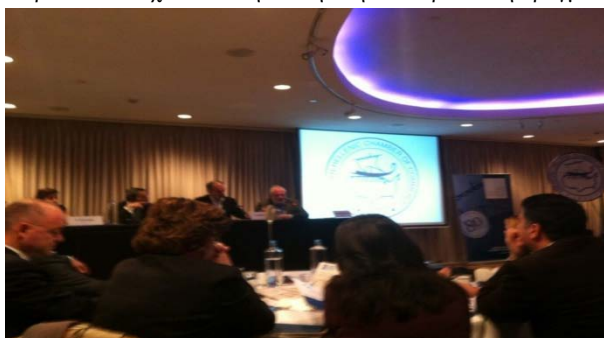
Εικόνα 10: Φωτογραφικό στιγμιότυπο από την εκδήλωση του Ελληνοαμερικανικού Εμπορικού Επιμελητηρίου