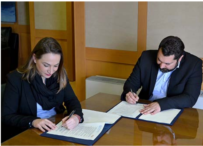
Σύμπλεγμα Εικόνων 6: Φωτογραφικό Στιγμιότυπο από την υπογραφή του Μνημονίου Συνεργασίας & Πρόσκληση για την εκδήλωση με αφορμή την Παγκόσμια Ημέρα για την Γυναίκα