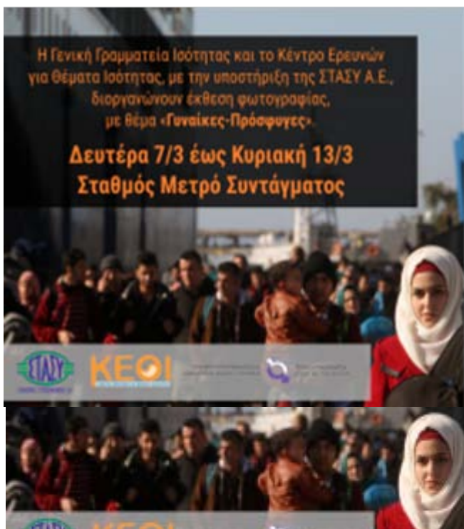
Σύμπλεγμα Εικόνων 9: Στιγμιότυπα από την Έκθεση φωτογραφίας στο Μετρό Συντάγματος και η αφίσα της δράσης