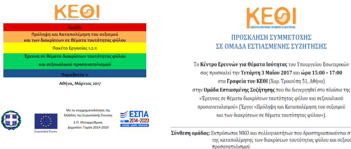
Σύμπλεγμα Εικόνων 2: Υλικό από τις δράσεις και τα παραδοτέα του Έργου