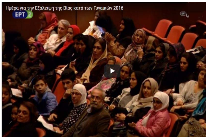
Σύμπλεγμα Εικόνων 14: Η αφίσα της Εκδήλωσης και φωτογραφικό στιγμιότυπο από τις συμμετέχουσες γυναίκες πρόσφυγες