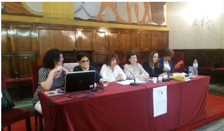
Εικόνα 11: Φωτογραφικό στιγμιότυπο από το εισηγητικό πάνελ της εκδήλωσης στο Πάντειο