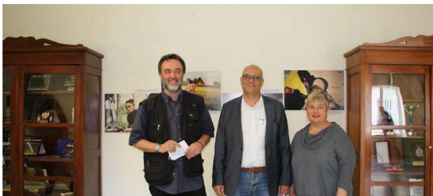
Εικόνα 12: Στιγμιότυπο από τα εγκαίνια της Έκθεσης στα Χανιά με τους εκπροσώπους του Κ.Ε.Θ.Ι. και του Δήμου Χανίων