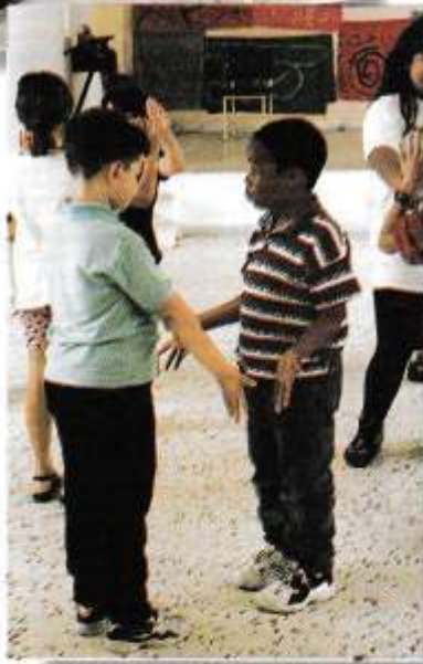
"Ο καδρέφτης που δεν σπάει"